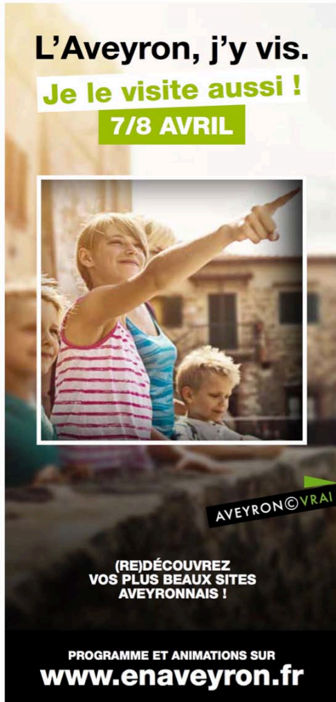
Flyer - Recto