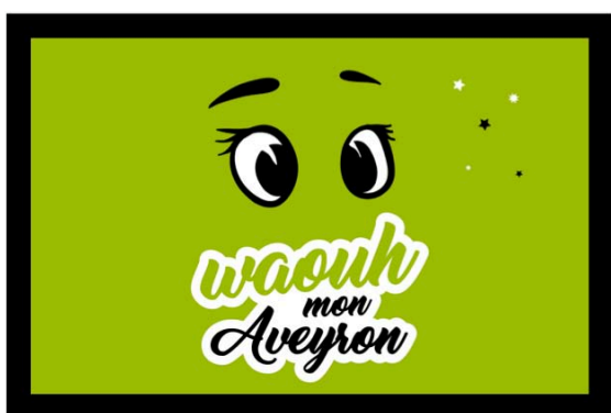
Bulletin - Recto

Pour cela, il vous faut préparer une urne pour recevoir les bulletins de participation. Comme nous vous le suggérons ci-après, vous pouvez utiliser une boîte (à chaussures ou autre). Ensuite, il vous faut prévoir une fente, un habillage neutre et coller un bulletin face « WAOUH mon Aveyron » visible pour identifier le jeu concours. Cette urne est à placer vers vos billetteries respectives. Et surtout, n'hésitez pas à distribuer les bulletins en expliquant le jeu concours et le lot à gagner !